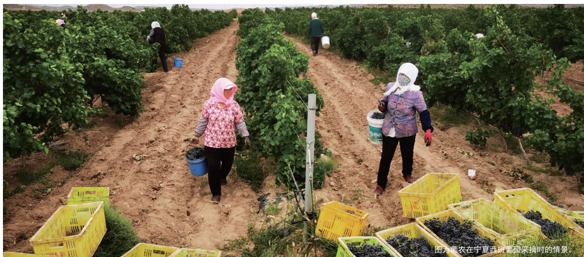
图为葡农在宁夏西班牙葡萄园采摘时的情景。

达尔文在 1859 年出版的《物种起源》提出了“物竞天择，适者生存”的进化论。即物种与自然之间的抗争，能